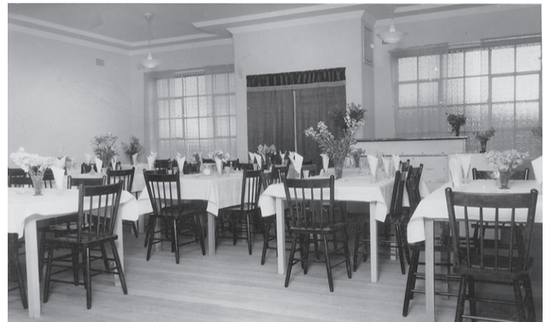
The dining room in Estonian House.

Transfer request forms are available from the Board together with an Explanatory Note which provides details of any transfer fees applicable and the option of transferring shares to local Estonian organisations such as the Church and the Archives.