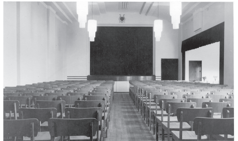
The hall in the old Estonian House