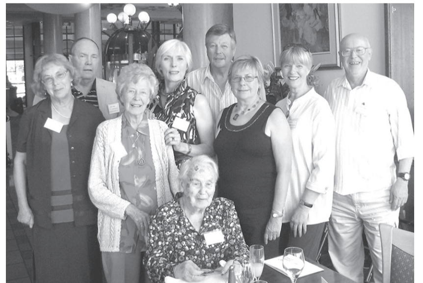
"General Omar Bundy" 60 aasta kokkutulek 20. märtsil 2009.