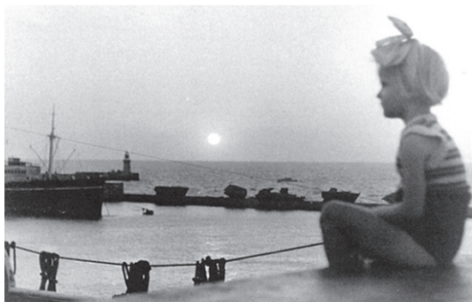
Kaie (Gilbert) Laanekõrb "Bundy" pardal Port Said'is.